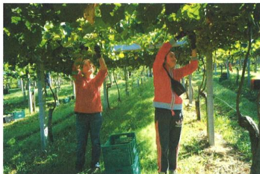
Vendimia nas Rías Baixas

A vendima deste 2015 nas cinco denominacións de orixe de Galicia (Monterrei, Rías Baixas, Ribeira Sacra, Ribeiro e Valdeorras) pode cualificarse como excelente, de acordo coas